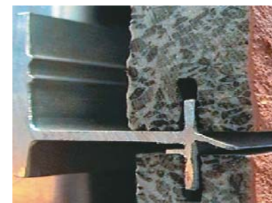
➤ Encontre d'elements ULMA Hormigón Polímero